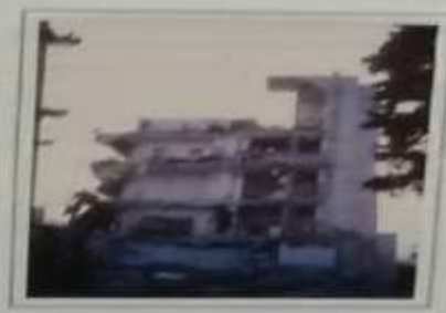
Εξαιρετικά φθαρμένο κτήριο στην οδό Φιλοθέης