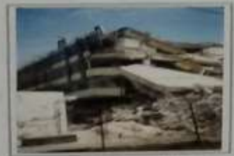
Καταρύση οροφής κτηρίου