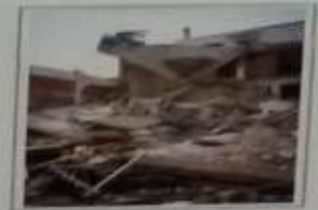
Καταρύση οροφής κτηρίου