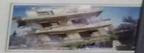
Καταρύση οροφής κτηρίου