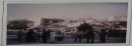
Καταρύση οροφής κτηρίου