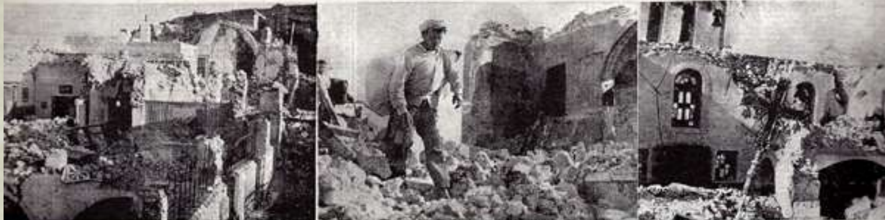
Τρεις χαρακτηριστικοί φωτογραφίες από την καταστροφή και έπειτα η Σακερίνη κατά τον τροφαντικό σεισμό που συνελάλησε την γραφική νήσο της Δουκάρι.

ΑΥΤΗΝ ΤΗΝ ΕΙΚΟΝΑ ΤΗΣ ΠΛΗΡΟΥΣ ΚΑΤΑΣΤΡΟΦΗΣ ΚΑΙ ΤΗΣ ΕΡΗΜΩΣΕΩΣ ΠΑΡΟΥΣΙΑΖΕΙ Η ΓΡΑΦΙΚΩΤΕΡΑ ΝΗΣΟΣ ΤΩΝ ΚΥΚΛ