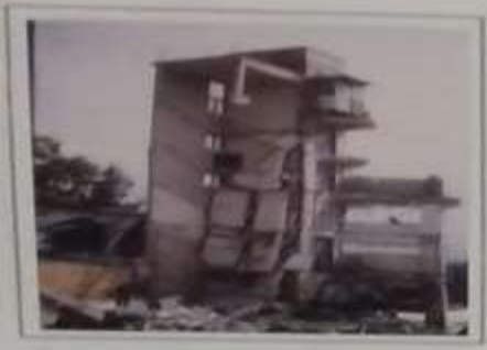
Καταρρεύσεις κτηρίων στο Αιγάλεω της Πρωτεύουσας