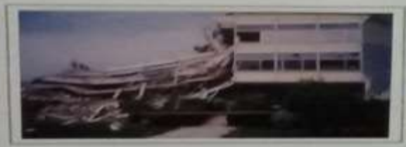
Αποφρακτική οροφή κτηρίου Αιγάλεω