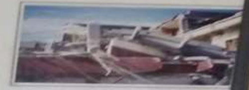
Εξαιρετικά φθαρμένο κτήριο