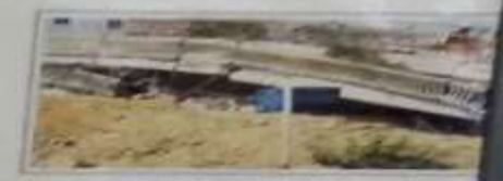
Καταρύση οροφής κτηρίου