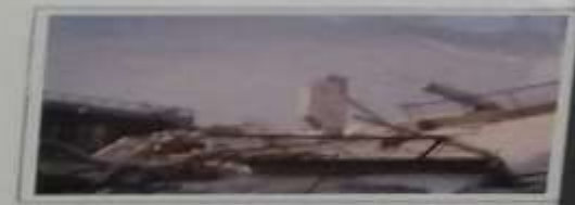
Καταρύση οροφής κτηρίου