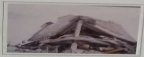
Καταρύση οροφής Αιγάλεω